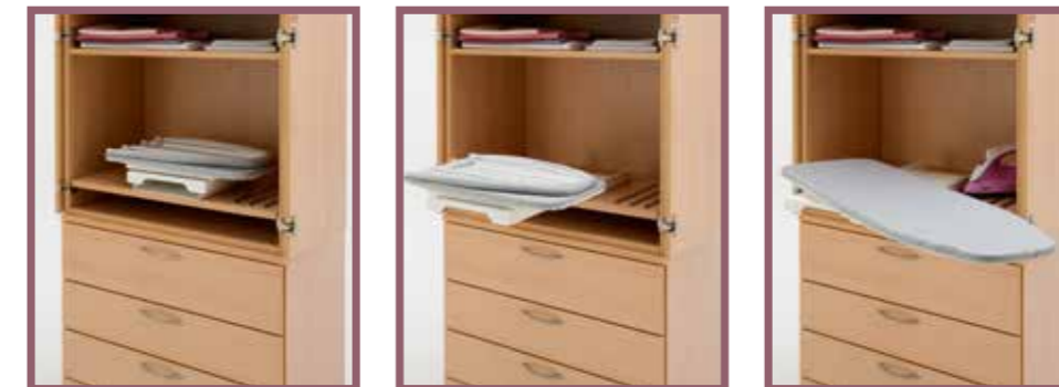
Möbel: layer mit optionalem ausziehbarem Bügelbrett Furniture: layer with the optionally extensible ironing board Meuble : layer avec planche à repasser extractible en option