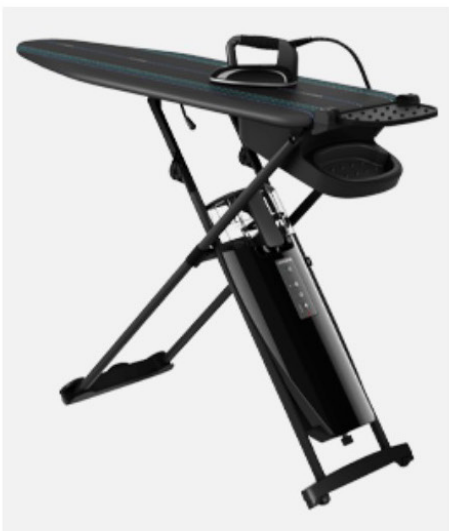
LAURASTAR SMART U