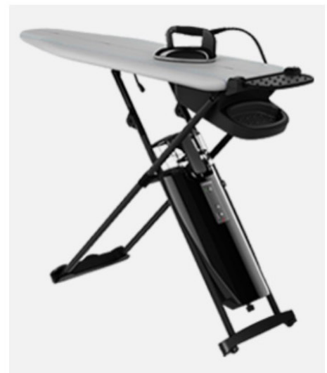
LAURASTAR SMART M