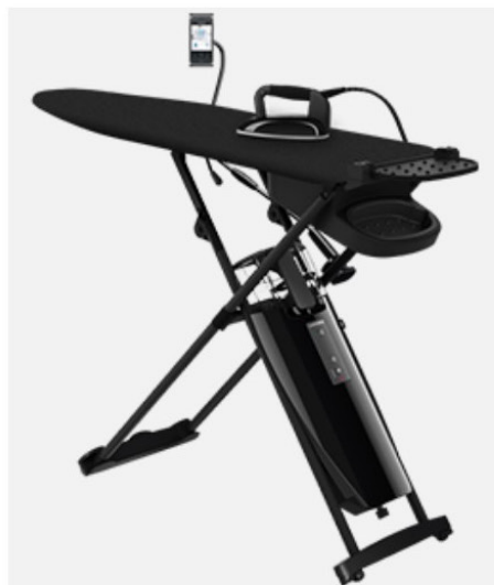
LAURASTAR SMART M LIMITED EDITION