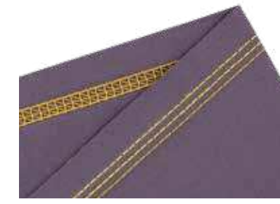
4-Faden-Coverstich für besonders glatte Saumabschlüsse