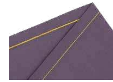
Kettenstich stabile Heft- oder Verbindungsnaht