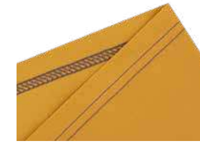
3-Faden-Coverstich für alle Arten von Saumabschlüssen