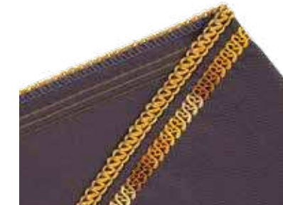
7-Faden-Expressivstich bestehend aus Dreifach-Coverstich und schmaler 3-Faden-Overlocknaht

mit Ziergarn in den Greifern: Blickfang für offene Stoffkanten