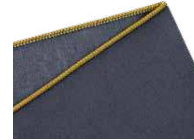
3-Faden-Rollnaht schmale Versäuberungsnah für dünne Stoffe