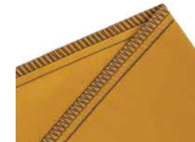
5-Faden-Sicherheitsnaht bestehend aus Kettenstich und 3-Faden-Overlocknaht

Säumen und Versäubern in einem Schritt – Standardnaht in der Bekleidungsindustrie