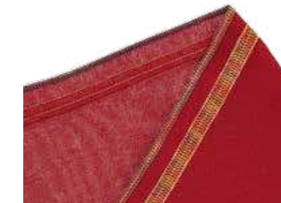
7-Faden-Expressivstich bestehend aus 4-Faden-Coverstich und 3-Faden-Rollnaht

Säumen und Versäubern in einem Schritt – Standardnaht in der Bekleidungsindustrie