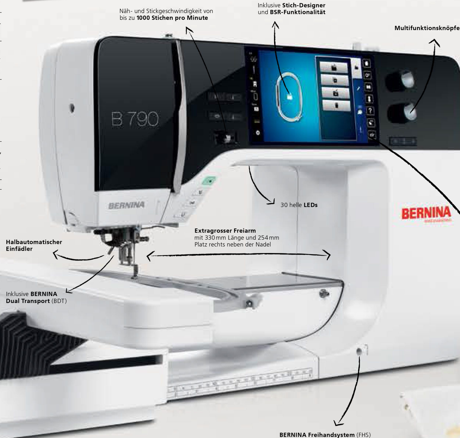
Näh- und Stickgeschwindigkeit von bis zu 1000 Stichen pro Minute