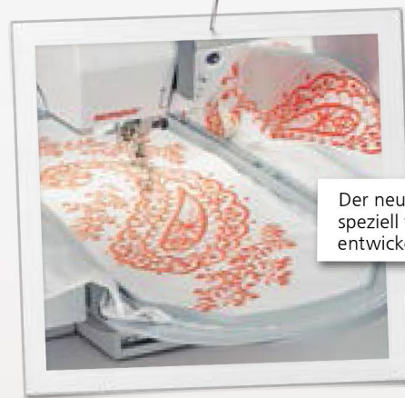
Der neue Maxi-Hoop wurde speziell für die BERNINA 7er Serie entwickelt.

Die BERNINA 790 verfügt über eine ganz besonders innovative Funktion: den Stich-Designer. Kreieren Sie eigene Stiche, indem Sie Ihre Ideen direkt auf den Touchscreen zeichnen. Die B 790 wandelt das Motiv mit einem Klick in ein Stichmuster um. Oder verändern Sie bestehende Stiche nach eigenen Vorstellungen. Durch das Abspeichern der ganz eigenen Stichkreationen lässt sich die Stichbibliothek laufend erweitern.